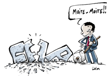
LE PARITARISME SELON DARMANIN

Précision : il sera possible de glisser des vœux hors école et sa circonscription au rang voulu sans annuler les bonifications.