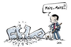
LE PARITARISME SELON DARMANIN

→ La bonification pour « rapprochement de conjoints » reste à 6 points et s'applique à nouveau également si la résidence administrative du conjoint est dans un département limitrophe.